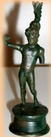
Figur des Lenus Mars

An der Stelle des heutigen Ortes befand sich das römische Straßendorf Cardena. In einem großen Töpferbezirk fertigte man Weihegeschenke an, die die Gläubigen dem Gott als Opfer darbrachten.