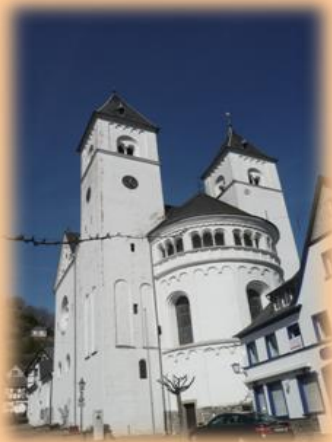
Stiftskirche St. Castor

Karden, am Unterlauf der Mosel, 40 km vor Koblenz gelegen, wird zu Recht als der kulturgeschichtlich bedeutsamste Ort zwischen Koblenz und Trier bezeichnet.