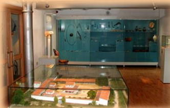
Keltisch-Römische Abteilung (Stiftsmuseum Treis-Karden)

Über den Lenus-Mars Weg, Teilstück der Etappe von Cochem nach Treis-Karden, benötigen Sie ab Pommern 45 Minuten und ab Karden 1 Stunde.